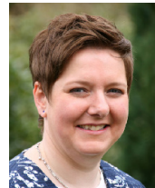
Alexandra Kock Finanzverwaltung